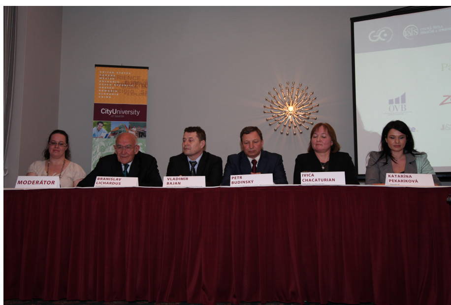
slávnostné vyhlásenie výsledkov a galavečer národného kola GMC, Radisson Hotel Bratislava