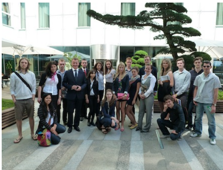
študenti VŠM a CityU na exkurzii v Kempinski Hotel Bratislava