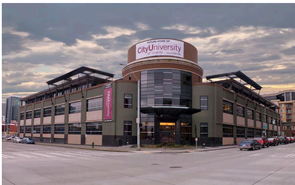
Nové sídlo centrály City University of Seattle v Seattle

Medzinárodná spolupráca Vysokej školy v pedagogickej oblasti sa opiera predovšetkým o spoluprácu so zriaďovateľom – City University of Seattle – v USA a v jej európskych pobočkách. Existuje intenzívny program výmeny učiteľov a zamestnancov obidvomi smermi.