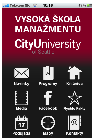
aplikácia pre iPhone

Počas mesiaca august VŠM uzatvorila zmluvu so spoločnosťou SNABB, s.r.o., ktorej cieľom je vývoj mobilnej aplikácie VŠM pre platformu iOS (iPhone). Súčasťou aplikácie je informácia o škole a programoch, novinky, informácie z knižnice, Facebook, podujatia a akademický kalendár školy a kontakty a mapy.